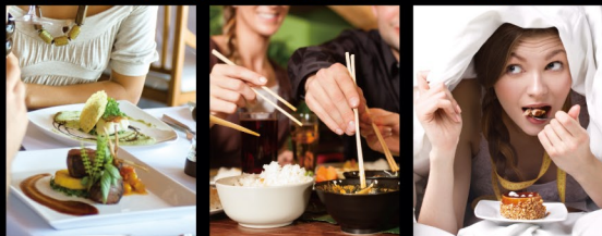
油っこい食事に 外食や会食の席に 甘い物や間食の前に